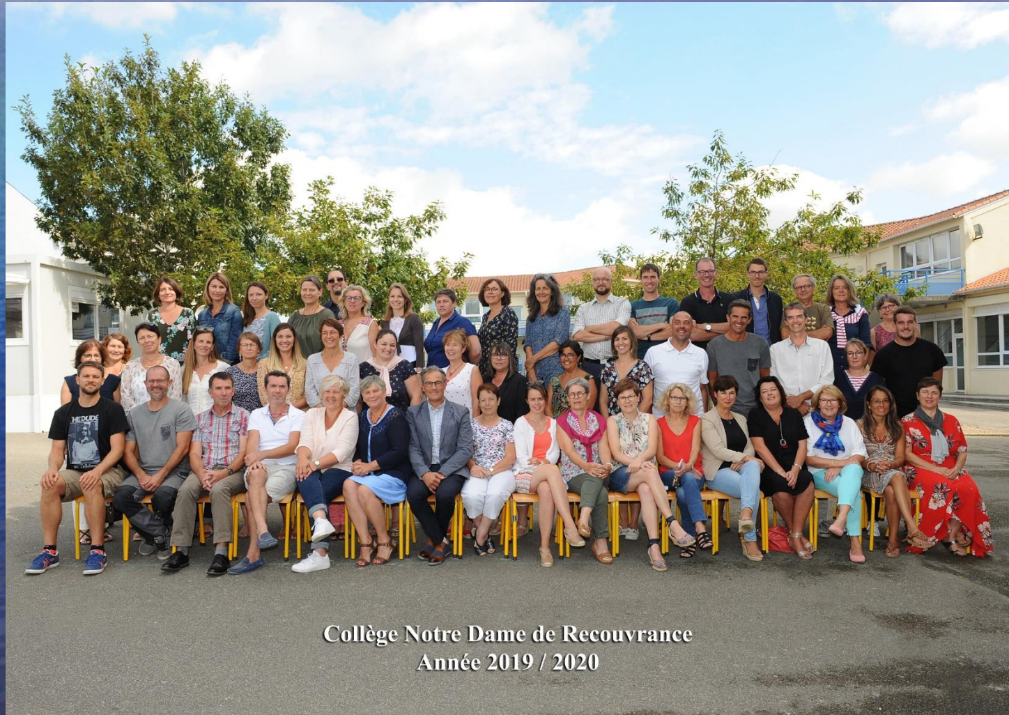
Collège Notre Dame de Recouvrance Année 2019 / 2020